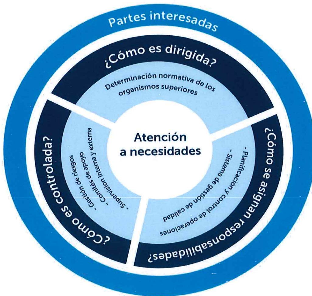
Imagen 1: Marco de Gobierno Corporativo Institucional.

autoridades; seguidamente se da respuesta a la interrogante de ¿Cómo se asignan las responsabilidades? Cada unidad organizativa define su planificación y programación de corto y largo plazo, con el objetivo de facilitar la evaluación de la gestión institucional; así como, de sus funcionarios y empleados; de esta manera se determinan las responsabilidades a todo nivel; así mismo se ha establecido la adopción del Sistema de Gestión de Calidad, el cual determina niveles de responsabilidad en la determinación y ejecución del mismo; finalmente se da respuesta a la interrogante ¿Cómo es controlada? La gestiones de control que se llevan a cabo en el instituto incurren principalmente en tres áreas de control: siendo la primera la gestión y monitoreo de riesgos, que incluye la identificación de los factores de riesgo internos y externos que puedan obstaculizar una adecuada administración y que impidan el logro de los objetivos institucionales y operativos; en segunda instancia la gestión de control y monitoreo de los comités de apoyo, conformados para monitorear las acciones de auditoria, riesgos, inversiones y prevención de lavado de dinero; finalmente la institución es controlada a través de la ejecución de supervisiones y/o auditorias coordinadas internamente o por los entes fiscalizadores. Es de esta manera que gráficamente se agrupan los conceptos determinados para conformar el marco de Gobierno Corporativo para el IPSFA, ver imagen 1.